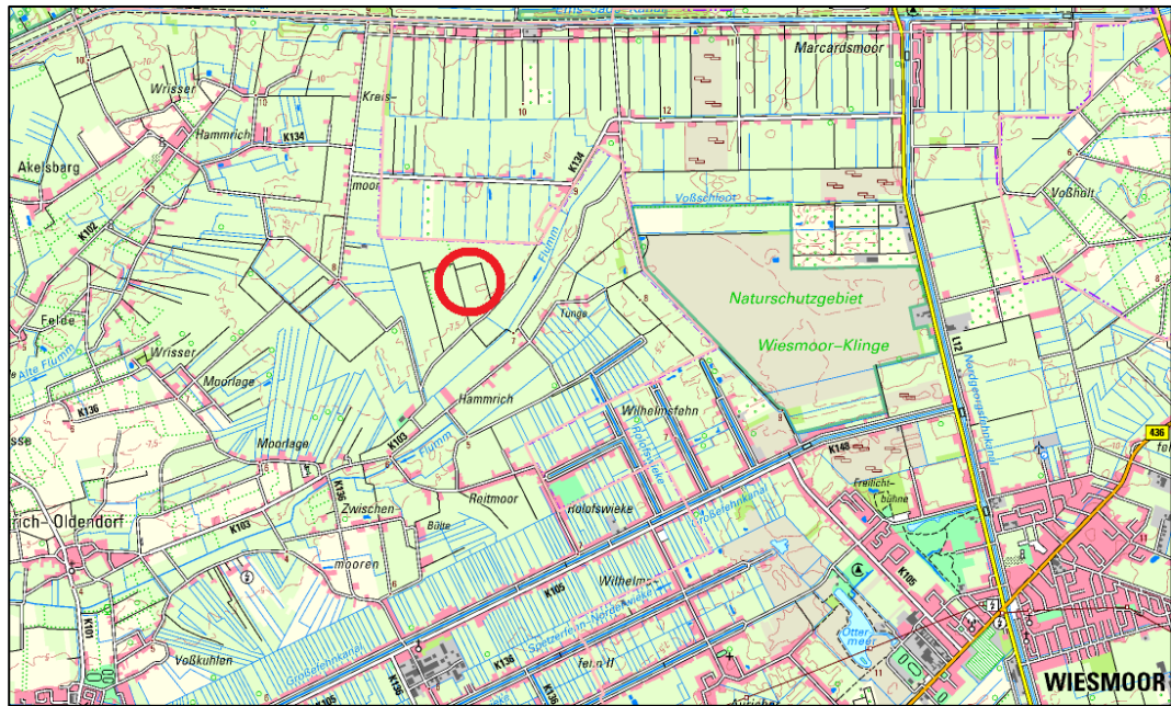
Abbildung: Ausschnitt aus der topografischen Karte bzw. Liegenschaftskarte (ohne Maßstab) mit Lage der zugeordneten Kompensationsfläche (rot umkreist)

Für die Bewirtschaftung der Flächen im Kompensationsflächenpool bestehen entsprechende Auflagen, durch die die gewünschte Entwicklung der Biotope gewährleistet wird.